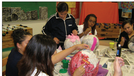
Multicultural Arts and Crafts at the Ames CLC. Artes Multiculturales en el Centro Comunitario de Ames.

Help support prevention programs in the schools like peace circles by making a tax-deductible donation to LSNA. You can donate online at www.lsna.net , mail a check, or drop one off at LSNA, 2840 N. Milwaukee Ave. Chicago, IL 60618.