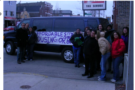
LSNA leaders visited Aldermen asking them to amend Mayor Daley's housing ordinance. Líderes de LSNA visitaron a los concejales pidiendo que apoyaran unas enmiendas a la ordenanza de vivienda del Alcalde Daley.